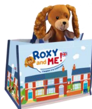
Roxy and me, l'anglais à la maternelle Editions Sed