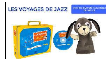
Les voyages de Jazz Edition Sed