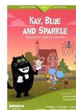
Kay, Blue and Sparkle, découverte de l'anglais en maternelle Scéren